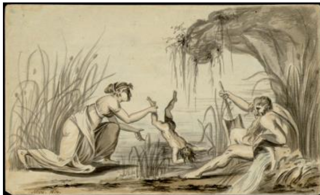
(Joachim Godske Schow műve)

5. Hogyan kapcsolódik Akhilleusz életéhez az alábbi kép? Röviden fogalmazd meg!