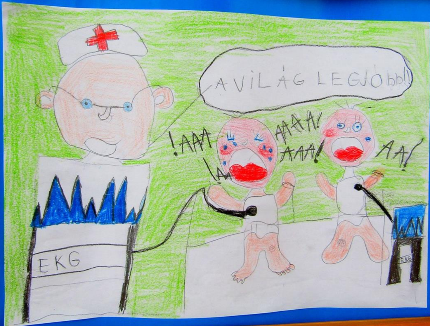
Ő is torkaszakadtából ordít...