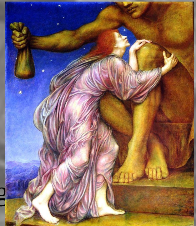
Mammon imádata Evelyn De Morgan (1909)