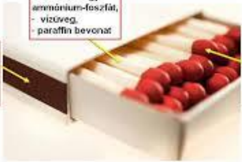
A biztonsági dörzsgyufa anyagai

gyufafej: - oxidálószer (pl. ólomoxid stb.), - antimon-szulfid, - üvegper, - színezék, - kötőanyag