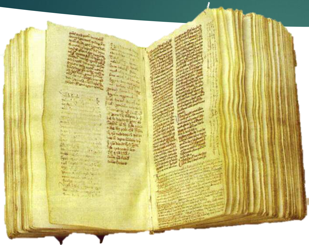
A magyar középkor első írásos emlékei