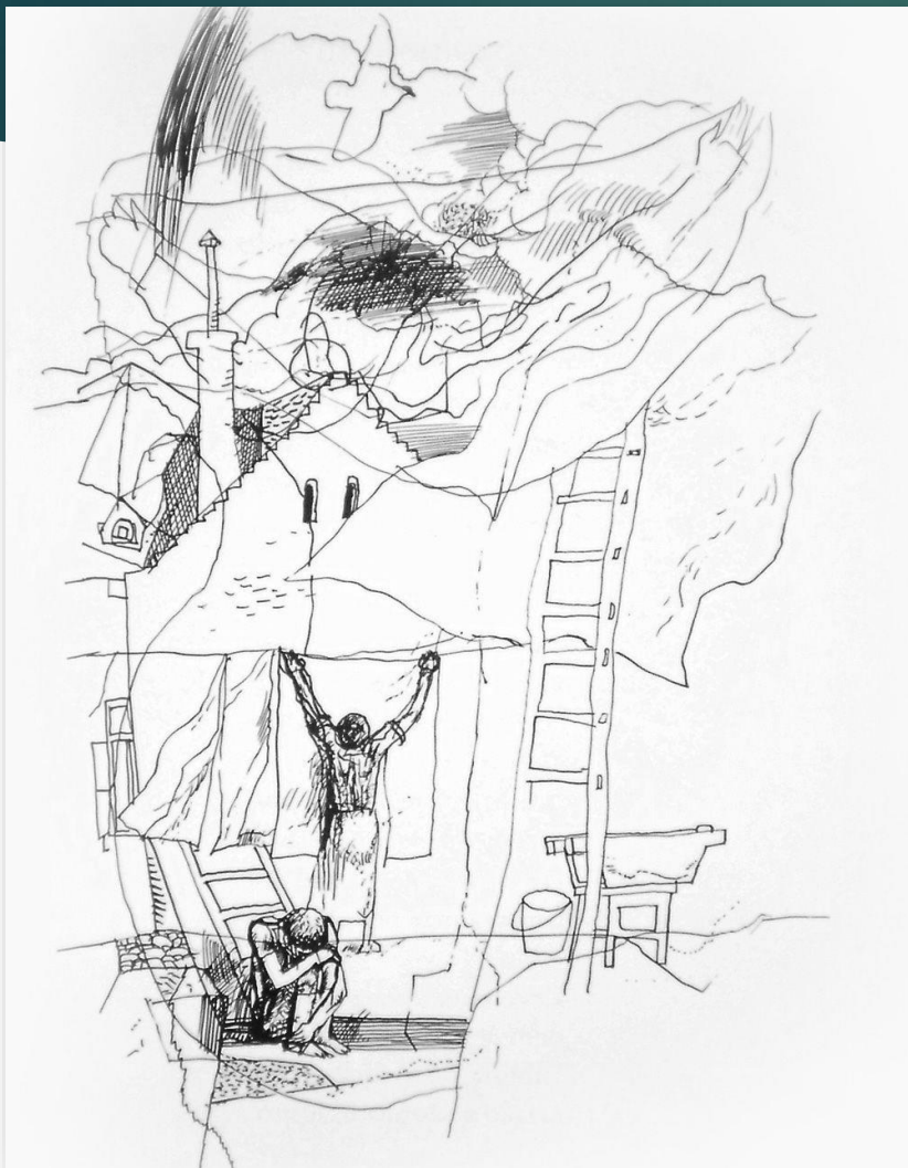
Würtz Ádám illusztrációja