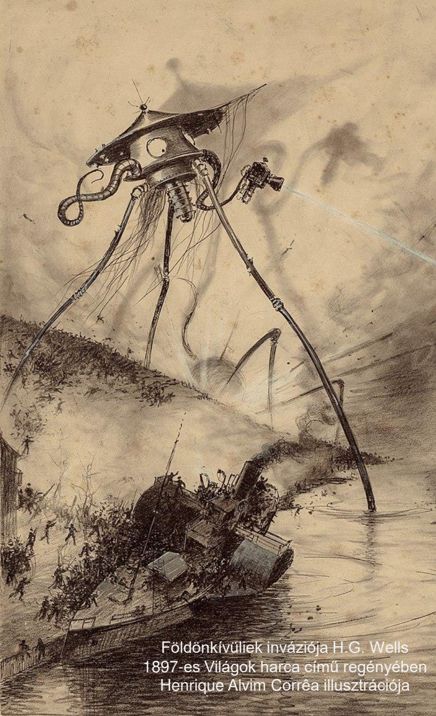
Földönkívüliek inváziója H.G. Wells 1897-es Világok harca című regényében Henrique Alvim Corrêa illusztrációja

A sci-fi az angol science fiction kifejezés rövidítése, aminek magyar jelentése tudományos-fantasztikus művészeti alkotás .